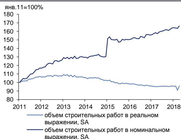
Рис. 2. ...главным образом благодаря улучшению динамики строительства