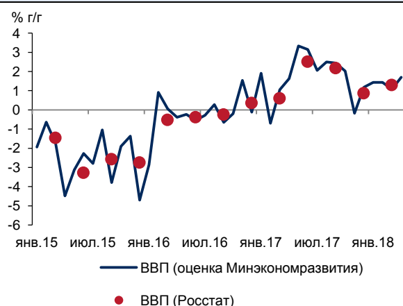
Рис. 1. Рост ВВП в апреле ускорился...