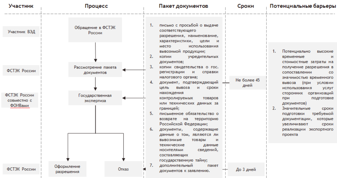
Рисунок 6. Схема получения разрешения Комиссии по экспортному контролю на временный вывоз