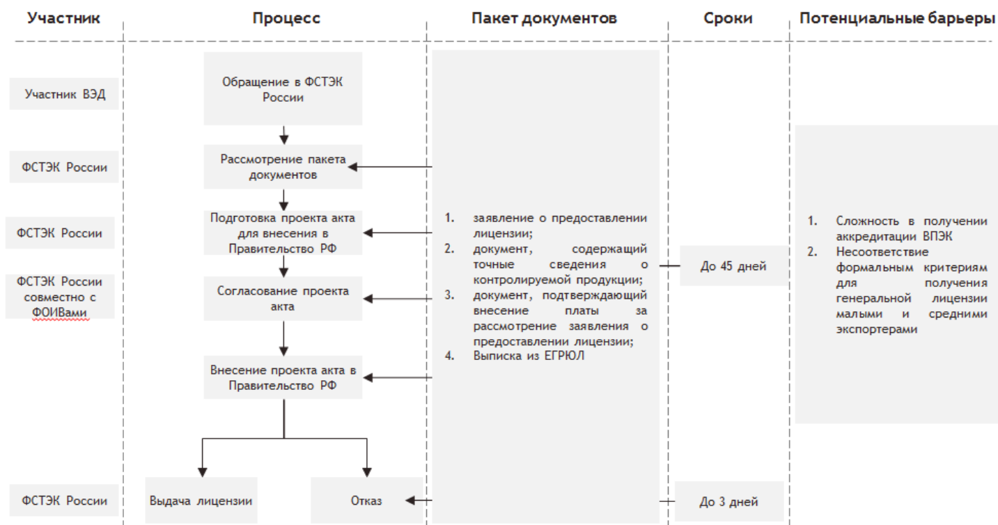
Рисунок 5. Схема получения генеральной лицензии ФСТЭК России