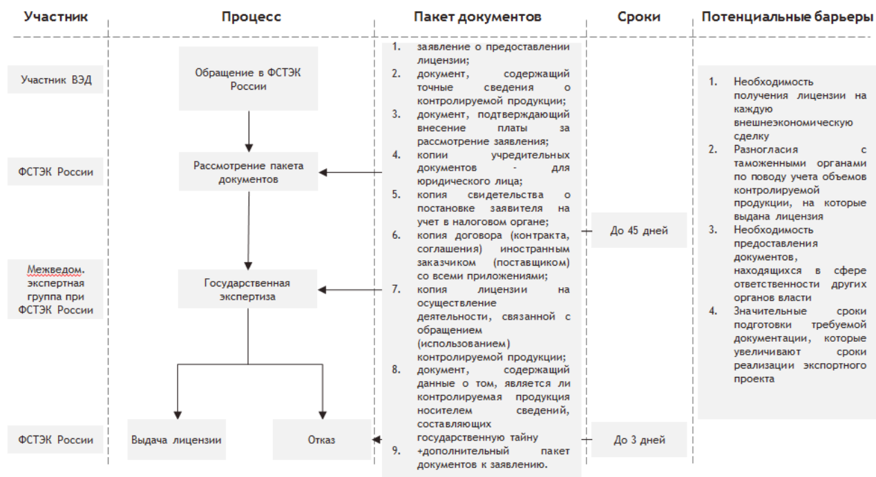
Рисунок 4. Схема получения разовой лицензии ФСТЭК России