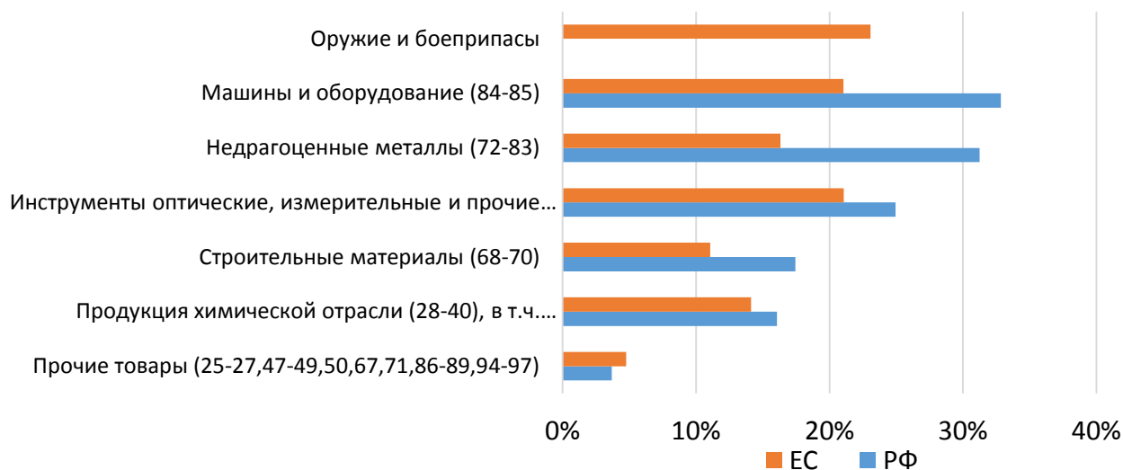
Рисунок 3. Доля продукции, которая подпадает под экспортный контроль (по основным категориям товаров)