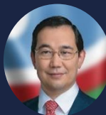
Глава Республики Саха (Якутия) Айсен НИКОЛАЕВ