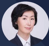
Министр экономики Республики Саха (Якутия) Майя ДАНИЛОВА